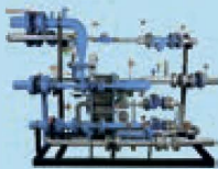
Установка индивидуальных тепловых пунктов