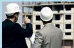
Осуществление строительного контроля