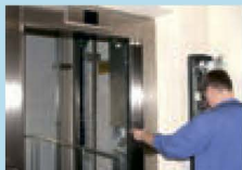
Ремонт или замена лифтового оборудования, ремонт лифтовых шахт