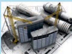
Разработка проектной документации

Дополнительный перечень услуг и (или) работ по капитальному ремонту, утвержденный Правительством Тюменской области: