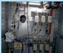
Ремонт внутридомовых инженерных систем

Перечень услуг и (или) работ по капитальному ремонту общего имущества в МКД включает в себя: