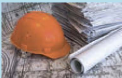
Проведение гос. экспертизы проектной документации