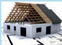
Переустройство плоской крыши на скатную крышу