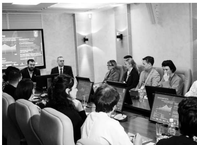
Участники круглого стола обсудили обмен опытом субъектов по внедрению регионального инвестиционного стандарта