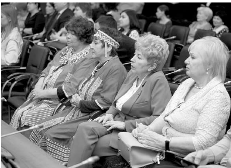
В прошлом году общественное признание получили не только НКО, но и стартапы

Грант губернатора Тюменской области – у проекта «Битва на Туре» региональной федерации сноуборда России. Это зимний фестиваль, полюболюбившийся многим тюменцам. Зрелищное шоу и мастер-классы, которые проводят на набережной Туры, обращают на себя внимание тысяч российских спортсменов.