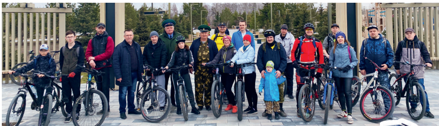
В конечной точке маршрута – в парке Пограничников, где установлена военная техника, ветераны провели для велосипедистов экскурсию