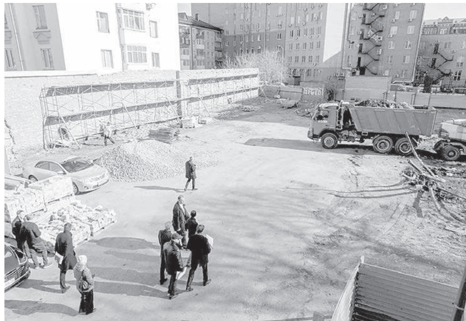
Место для отдыха горожан обустраивают на пустыре между институтом культуры и аптекой

Работы на этой площадке проводит ООО «Тюменьстройрегион». Сейчас сотрудники компании восстанавливают брандмауэрную кирпичную стену длиной 50 и высотой 5 метров. Рядом с ней потом будут размещать различные экспозиции.