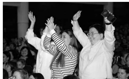
За учителей болели коллеги, учащиеся с родителями, родные и близкие