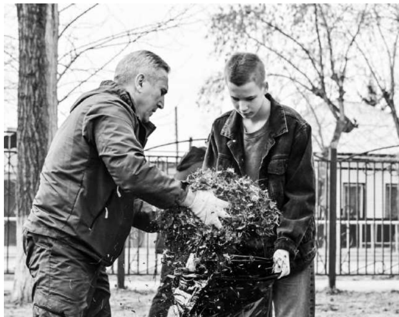
Глава региона вместе со школьниками навед порядок на участке