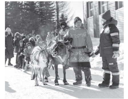
Детей катали на оленьей упряжке

Привезенная рыба быстро находит покупателя, да и вообще товар на прилавках не залеживается. Теперь можно присоединиться к другим гостям праздника и послушать выступления артистов, принять участие в состязаниях по национальным видам спорта: метанию тынзына на хорей,