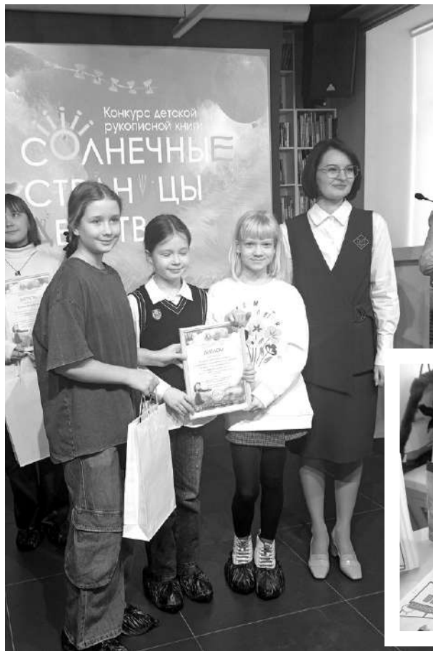
Награждение победителей