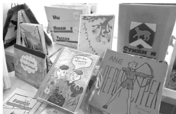
По итогам конкурса будет организована передвижная выставка изданий || Фото Ирины ТУНГУСОВОЙ

самая объемная – на каждой странице живет семья одной из национальностей, что проживает в Тюменской области.