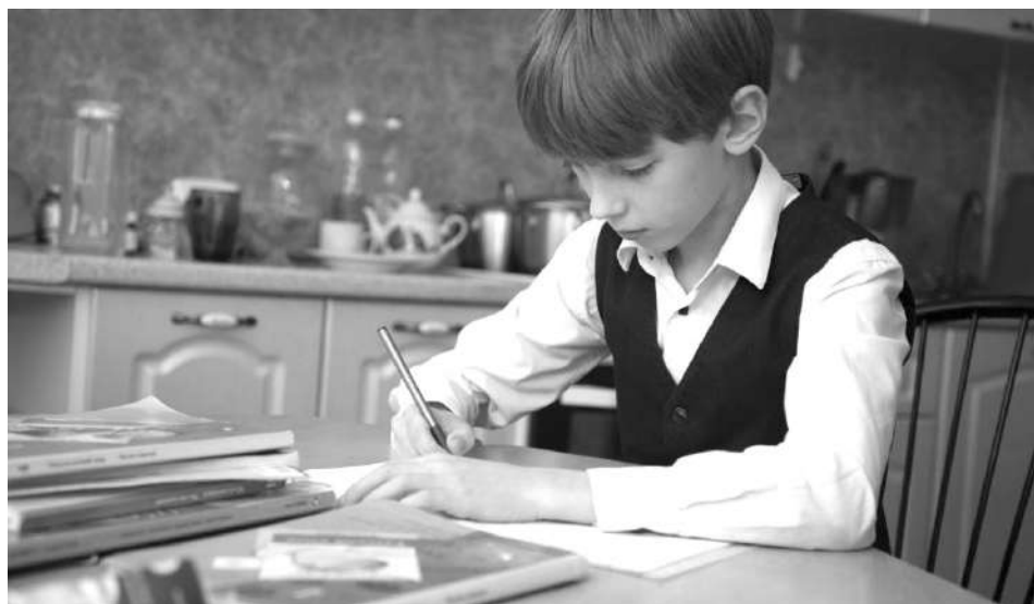
Регистрация позволит ученику самостоятельно ознакомиться с расписанием уроков, узнать домашнее задание