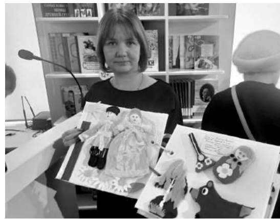
Обилие и разнообразие творческих работ поражают

До конца недели с рукописными книгами-победителями можно ознакомиться в библиотеке им. К. Лагунова. Затем часть работ уедет в Мурманск, чтобы принять участие в Международном конкурсе детской рукописной книги «Все краски Севера». С 19 февраля по 15 июня в Тюмени и Ялуторовске будет организована передвижная выставка изданий.