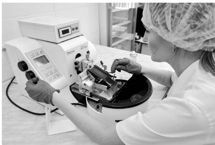
В патологоанатомическом бюро «Медицинского города» проводят исследование биоматериала