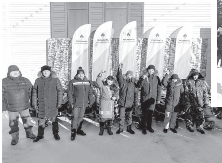
Семьям КМНС Уватского района вручены снегоходы

Представители коренных народов привезли на ярмарку свою продукцию: рыбу, мясо, ягоды, орехи. Домой многие семьи вернулись не с